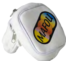
N.INP用ヘッドカバー ¥3,800 + 消費税