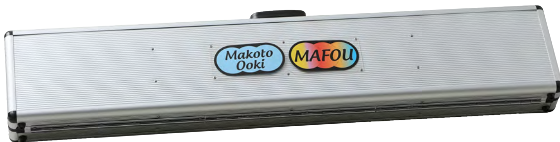
アタッチメントケース(中身は別売り)