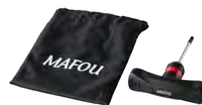
専用トルクレンチ ¥3,800 + 消費税

※ヘッドに取付済の塞ぎキャップは万が一破損の場合、別売りにて ¥600 + 消費税 となります。 ※ヘッドカバーにネームタグは標準装備されていますが万が一破損等で購入したい場合は ¥500 + 消費税 となります。