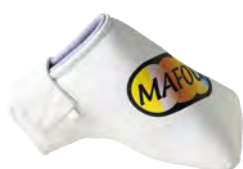
R/S.INP用共通ヘッドカバー ¥3,800 + 消費税