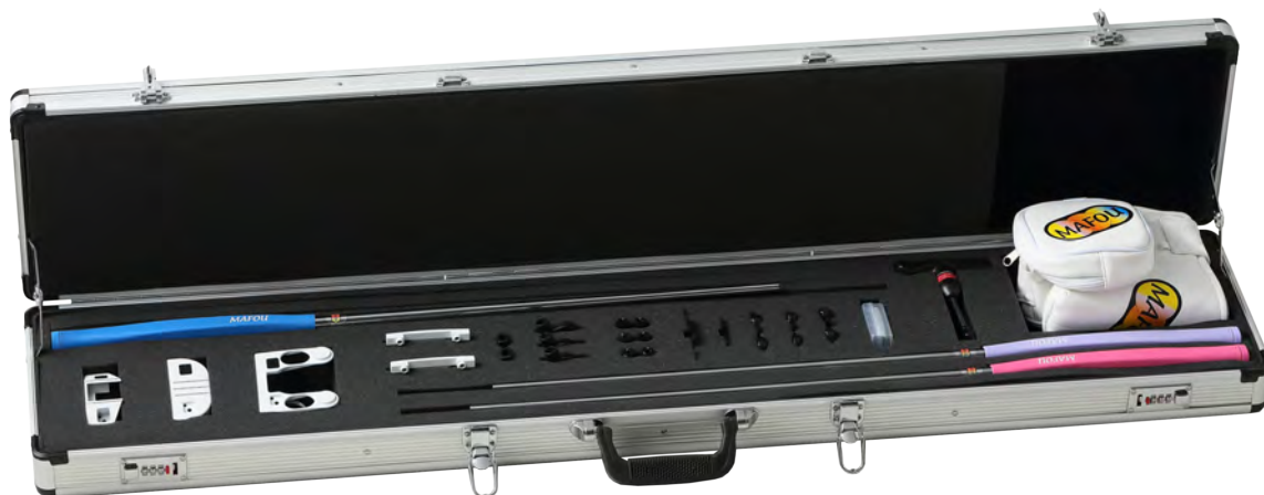
アタッチメントセット